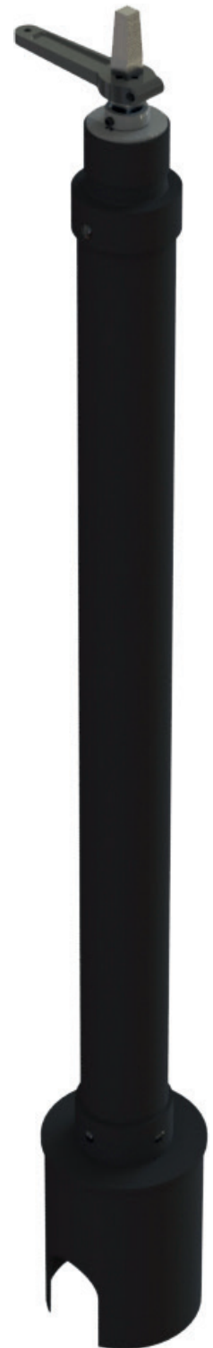
Zemní souprava EBS