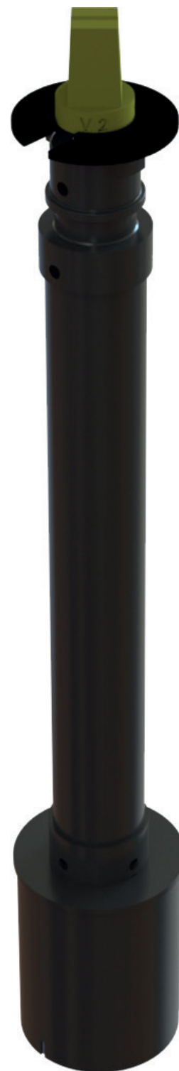
Zemní souprava KH-T

Výroba zemních souprav atypických délek, provedení a materiálů na vyžádání